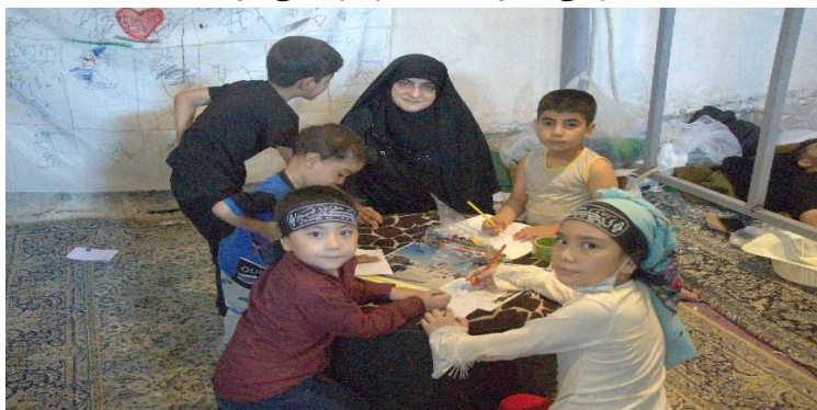
(اربعین ۱۴۰۳ ش)

برپاکنندگان مراسم پیاده روی اربعین از نیازهای فرهنگی و تفریحی زائران حاضر در مسیر غفلت نکرده و درصدد برطرف کردن آنها برآمده اند. از جمله برپایی موبک های فرهنگی که در آن انواع آموزش ها و سرگرمی ها برای کودکان و نوجوانان ارائه می شود. آموزش ها و سرگرمی هایی که در قالب انجام بازی های گوناگون، نقاشی و رنگ آمیزی صورت می گیرد. در کنار اینها، برای غنا بخشی اوقات استراحت و کیفیت گذر زمان زائران، از نمایش فیلم و پخش کلیپ های مذهبی و صوت های سخنرانی و مداحی در مسیر پیاده روی و در میانه برخی از موبک ها، بهره برده می شود.