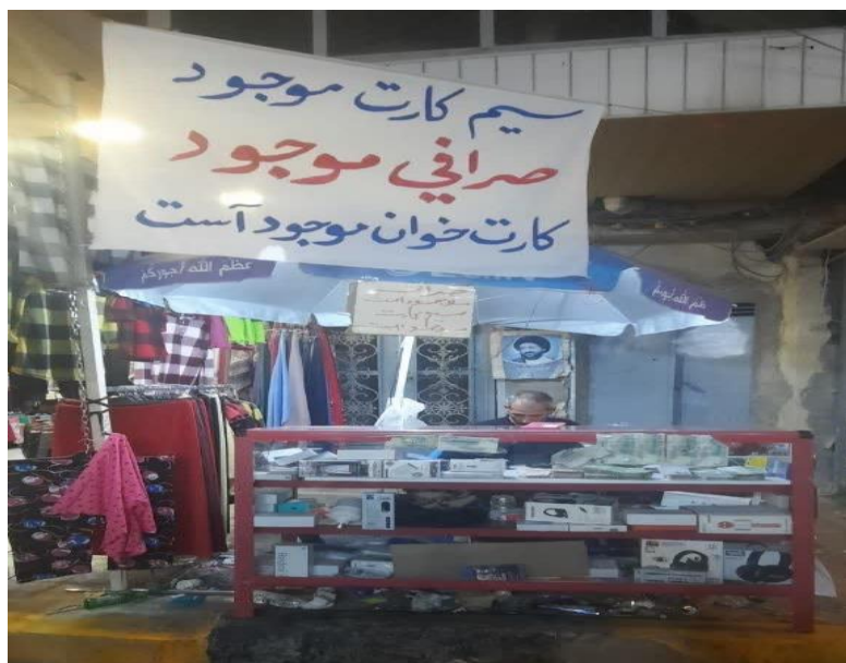
(تصویر از نگارنده، اربعین ۱۴۰۳ش)