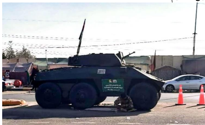
(تصویر از نگارنده، اربعین ۱۴۰۳ ش)

معمول می‌تواند شامل افرادی باشد که دست به بزه‌های خرد و کلان می‌زنند و یا دچار تنش‌های بین فردی بر سر موضوعات مختلف می‌شوند. از سوی دیگر، برگزاری مراسم پیاده‌روی اربعین، همواره ۱ در معرض تهدیدهای گروه‌های بالقوه و بالفعل معاند و مخالف این تجمع بوده (مشخصاً گروه‌های تکفیری و داعش) و لذا ایجاد و حفظ امنیت در کنار برقراری نظم در طی برگزاری این آیین، اهمیتی مضاعف داشته است. بر همین اساس، در تمامی راه و خصوصاً در قسمت مسیر داخل شهر کربلا تا رسیدن به بین الحرمین، شاهد حضور متعدد نیروهای نظامی و انتظامی عراقی به همراه ادوات جنگی سبک و سنگین هستیم.