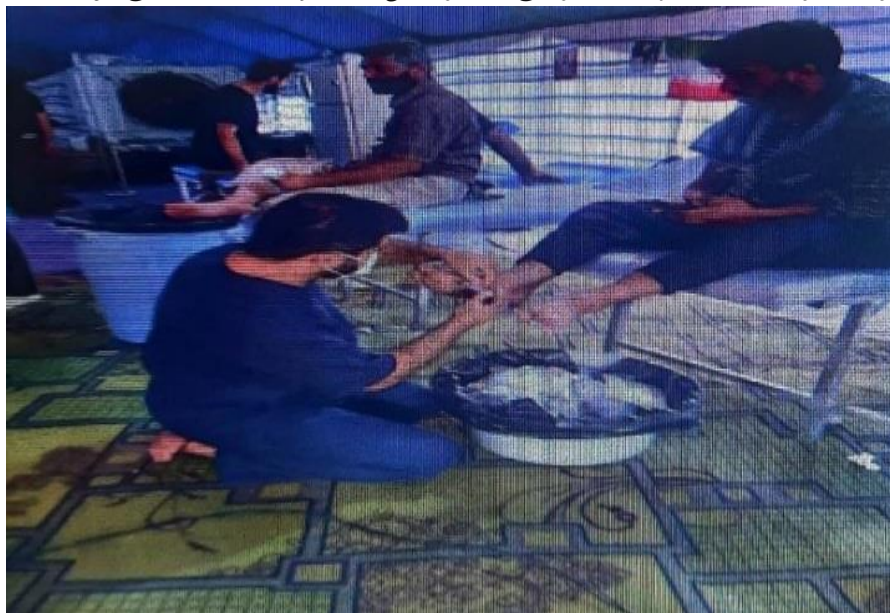
(تصویر از نگارنده، ۵، اربعین ۱۴۰۳ش)

عراق و ایران، در کنار گروه‌های مردمی حاضر از این دو کشور، مهیا و ارائه می‌شود.