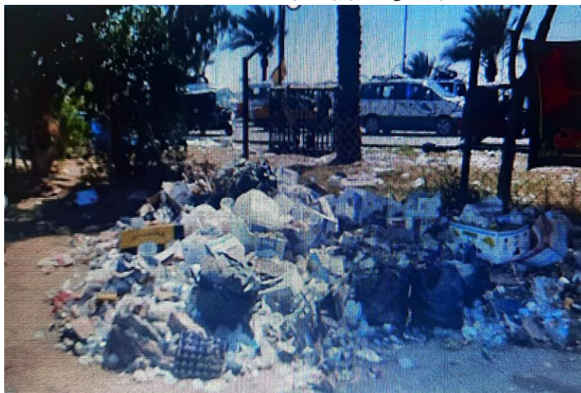
(تصویر از نگارنده، اربعین ۱۴۰۳ش)

تولید زباله‌های فراوان یکی از آسیب‌های جدی در طی برگزاری آیین پیاده‌روی اربعین است. چنانچه، با وجود تلاش زیاد نیروهای خادم حاکمیتی و مردمی عراقی و ایرانی، همچنان و به صورت دائمی، تل‌هایی از زباله در مسیر پیاده‌روی مشاهده می‌شود. در این میان، استفاده از ظروف یکبار مصرف که در چند سال اخیر استفاده از آنها افزون شده، مشکلات زیست محیطی عدیده‌ای را نیز به دنبال داشته است. رها سازی انبوهی از ظروف یکبار مصرف که برای محیط زیست اثرات مخرب جبران‌ناپذیری دارد، یکی از بارزترین آسیب‌های شکل گرفته در زمان برگزاری آیین است که باید مورد توجه جدی همگی نهادها، ارگان‌ها و نیروهای مردمی (چه خادم و چه زائر) کشورهای میزبان و مهمانان حاضر در این مسیر قرار گیرد.