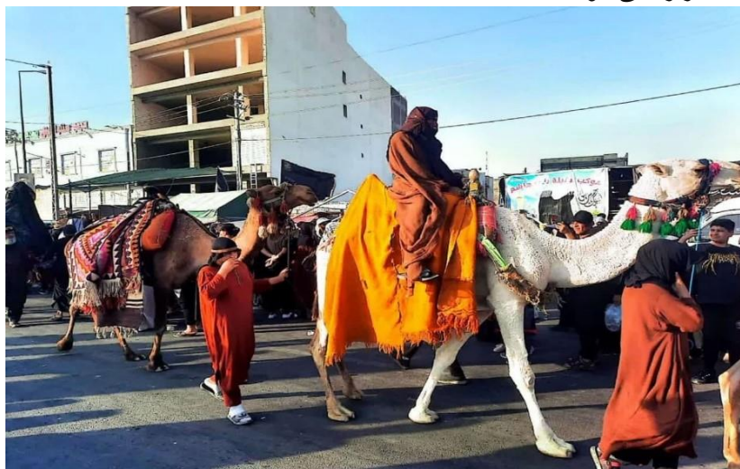
(تصویر از نگارنده، اربعین ۱۴۰۲ ش) ۱

مشغول شود. گاهی نیز به زبان ترکی و به ندرت به لهجه‌های دیگر، مراسمات عزاداری در موکب‌ها برگزار می‌شود.