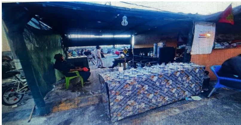
(تصاویر از نگارنده، اربعین ۱۴۰۳ ش)